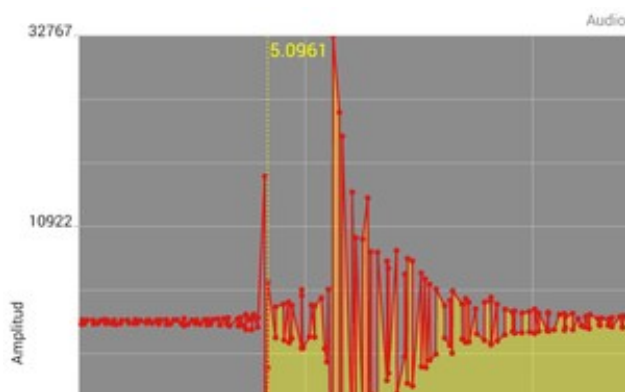
Selección del tiempo entre el sonido inicial de las tijeras y sonido final del choque

Tocando la pantalla con dos dedos se amplía la imagen hasta que se vean bien los dos ruidos, y se pulsa en el inicio del sonido (clic de las tijeras) y se vuelve a pulsar la pantalla al inicio del siguiente ruido (clonc de la bola). Aparecerá una banda amarilla entre los dos puntos, tal como muestra la figura.